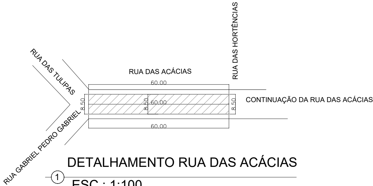
DETALHAMENTO RUA DAS ACÁCIAS ESC.: 1:100